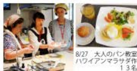
8/27 大人のパン教室 ハワイアンマラサダ作り 13名