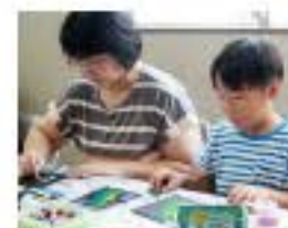
8/23 チョークアート 18名