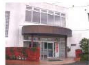
コープ会館 南足柄市中沼393

【大塚山線】 富士フィルム前駅…徒歩約10分 和田河原駅…徒歩約15分 駐車場 10台完備