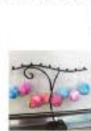
8/20 羊毛フェルトで作る オーナメントボール 12名