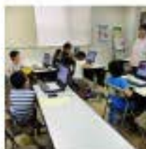
8/10 プログラミング教室① 9名