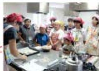
8/7 塩バターパン作り 36名