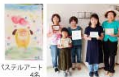
8/28 パステルアート 4名