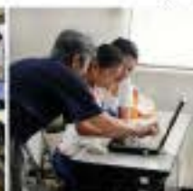
8/29 プログラミング教室② 24名