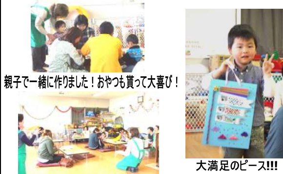
親子と一緒に作りました!おやつも貰って大喜び!

4月16日(月)に富水店2階にて自主活動グループ親子サロン企画で親子で壁掛け鯉のぼりを作りました。7組17名のご参加頂き、親子で合同作業。完成した作品の出来にお子様達も大満足の様子でした。ご参加ありがとうございました。次回は七夕の時期開催予定。