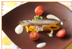
グリルししゃもと 彩り野菜の 柚子こしょう仕立て