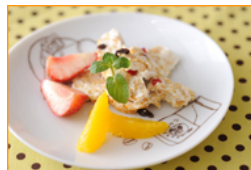
シリアル・ヌガー

COOP「おいしい低脂肪牛乳」を製造している森永乳業様の方が講師となって開催する料理教室です。乳製品のコクを生かし、カロリー、塩分は控えたカルシウムたっぷりのお料理です。