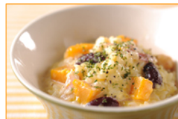
お豆とかぼちゃの クリーミーリゾット ペッパー風味